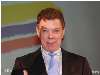
Juan Manuel Santos, presidente de Colombia.

La primera visita oficial a Alemania de Juan Manuel Santos, después de haber asumido la presidencia de Colombia en agosto de 2010, estuvo marcada por una agenda económica. Inversionistas alemanes ven oportunidades.